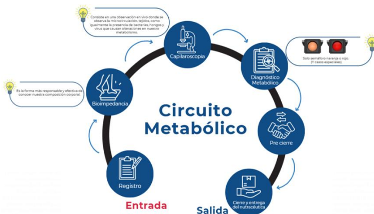
Figura 3. Metodología del Circuito Metabólico para realizar la Valoración Metabólica conforme a la Metodología del

Tampoco los evaluadores certificados en el Modelo Educativo del Sistema ATDM nivel 2 o superior que realizarán las pruebas de Capilaroscopia, no tienen tampoco una especificación o indicación