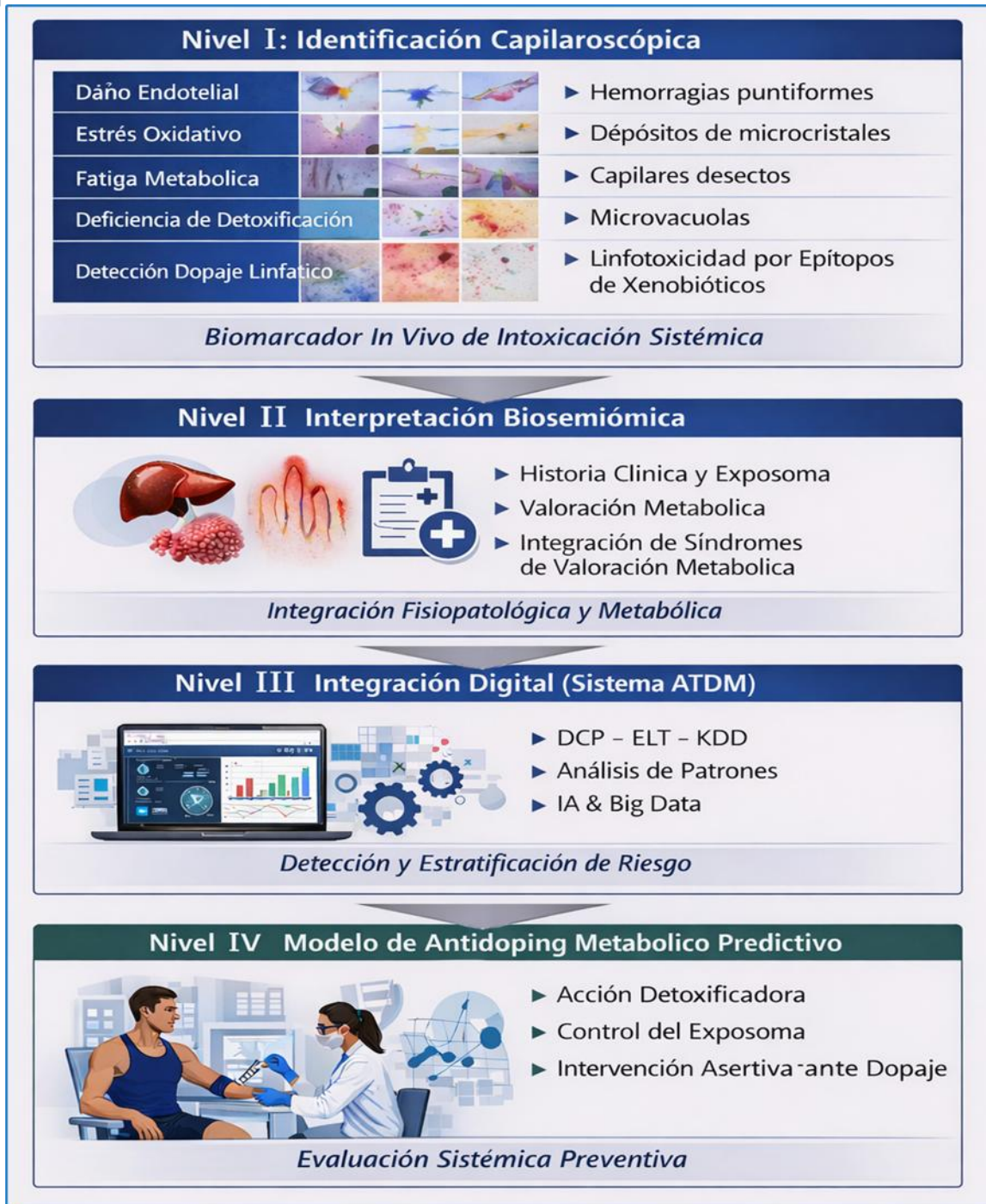
Figura 6. Propuesta de Modelo Integrativo de Antidoping Metabólico