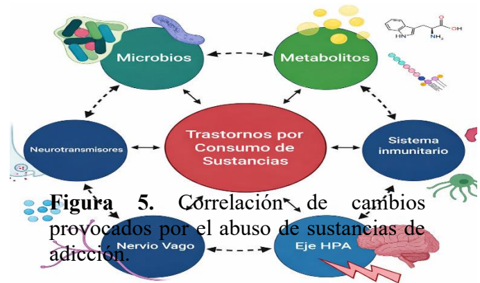
Figura 5. Correlación de cambios provocados por el abuso de sustancias de adicción.

La identificación capilaroscopia en el uso de sustancias de adicción, conforme a los pasos 1 a 4 anteriormente señalados, así como sus efectos en el metabolismo, el microbioma humano y otros factores como: el desbalance redox, la inflamación, y la modificación del sistema inmune, se explican en diversas publicaciones que el Dr. Abuadili ha realizado, (Abuadili Garza, 2025i, 2025j, 2025k, 2025l, 2025m, 2025n), y estos autores se comprometen a que en un artículo posterior, se desglosarán con mayor precisión, pero para efectos ejemplificativos, presentamos la siguiente correlación: