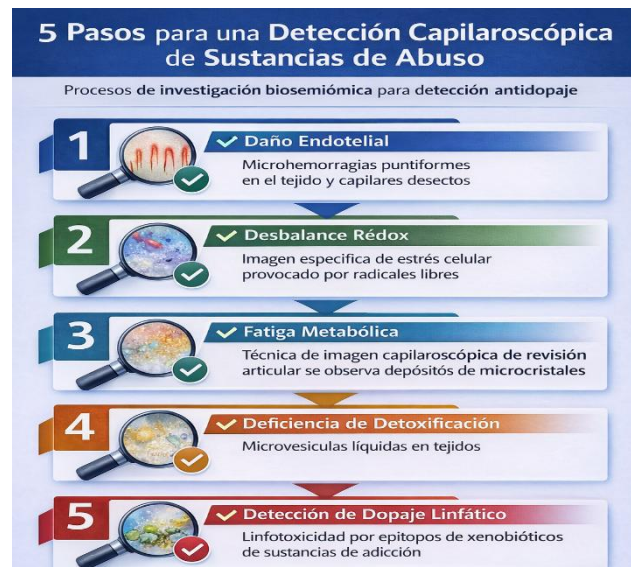
Figura 4. Pasos de la Investigación Biosemiótica de la Intoxicación Sistémica Exógena por Sustancias de Abuso.

y un modelo de investigación conocido como Biosemiótica Clínica Aplicada, en donde se estudian diversos componentes, tanto de una perspectiva desde la causa como de una perspectiva desde el efecto, proponemos 5 pasos para la Investigación Biosemiótica de la Intoxicación Sistémica Exógena lo cual resumimos en la Figura 4, donde se resume la investigación biosemiótica aplicando la metodología del Sistema ATDM, para la detección de sustancias de abuso.